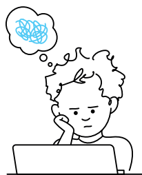
2. Moeite met concentreren