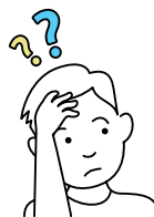
3. Dingen vergeten