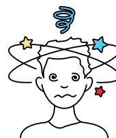
10. Duizelig zijn