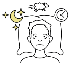
8. Moeite met slapen