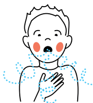
4. Benauwd zijn