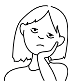
1. Moe zijn

De meeste mensen met Long COVID hebben meer klachten tegelijk. De klachten hieronder genoemd komen het meest voor: