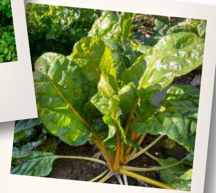
Als liefhebber van vergeten groenten een foto met daarop snijbiet afgebeeld uit onze eigen moestuin. Angela Coumans-Voncken

Het antwoord van de vorige puzzel was 'Vrijtijdsbesteding' . Veel inwoners hadden het juiste antwoord ingezonden samen met een leuke foto. Bedankt!