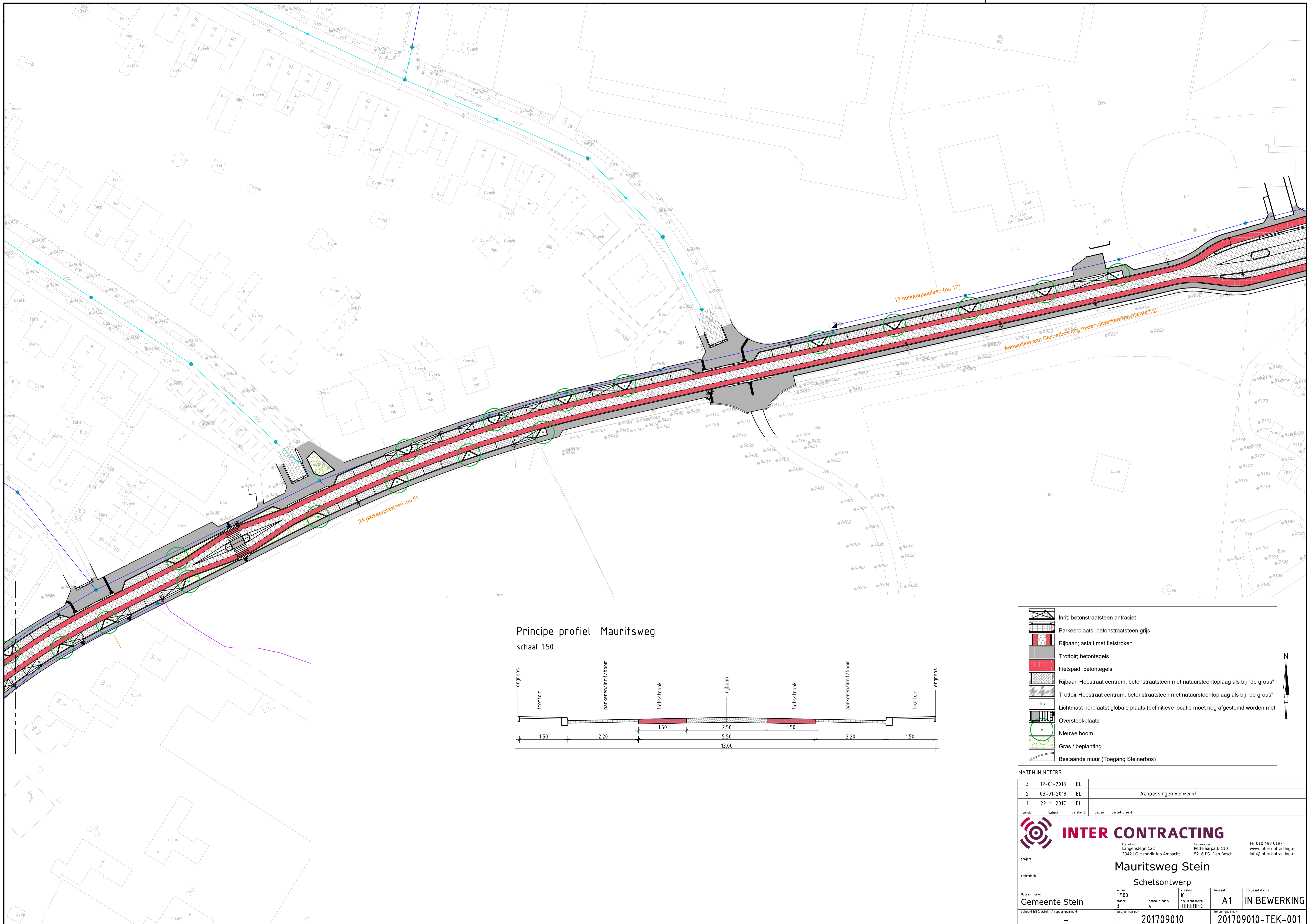
Principe profiel Mauritsweg schaal 1:50