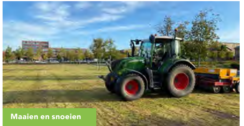
Maaien en snoeien

Bekijk het actuele overzicht en meer informatie op www.gemeentestein.nl/werk-in-uitvoering